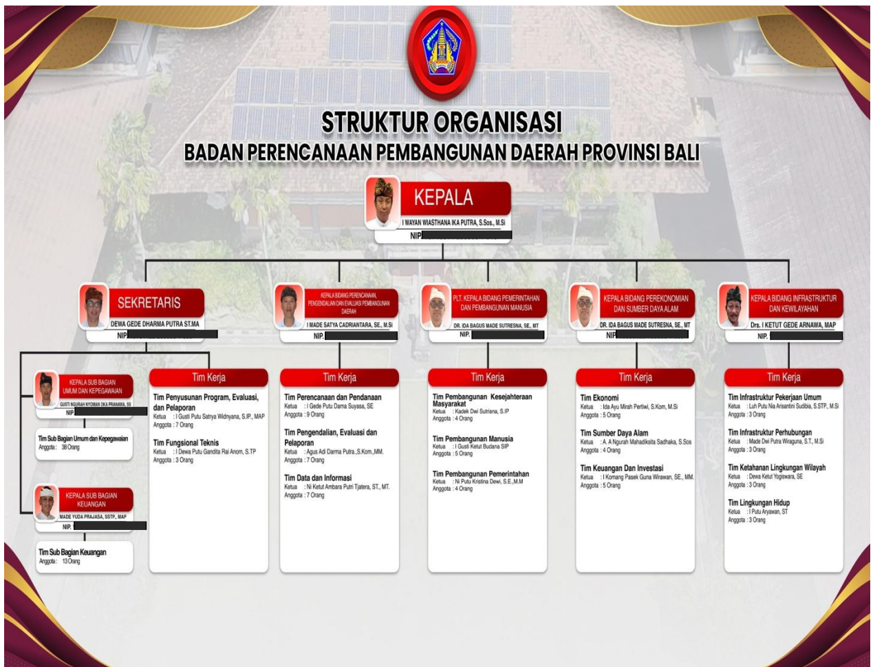
Gambar I.1 Struktur Organisasi Badan Perencanaan Pembangunan Daerah Provinsi Bali